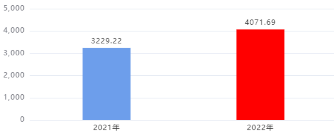
财政拨款收入、支出总计对比图 (单位：万元)

2022年度财政拨款收入总计、支出总计均为4,071.69万元，与上年相比收入总计、支出总计均增加842.47万元，增长26.09%，增长的主要原因是：人员经费、项目经费增加。